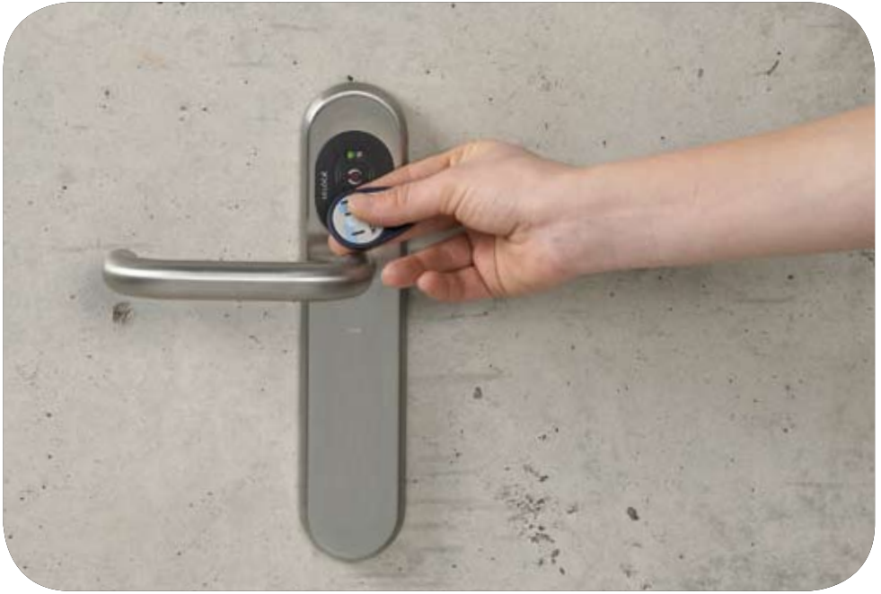
automatische Öffnung bei Annäherung des Mediums unter 5 cm