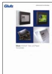
Prospekt Glutz Infoline®